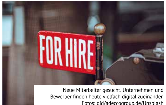
Neue Mitarbeiter gesucht. Unternehmen und Bewerber finden heute vielfach digital zueinander.