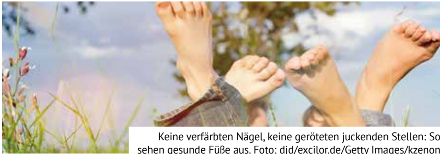
Keine verfärbten Nägel, keine geröteten juckenden Stellen: So sehen gesunde Füße aus.

„Gut durch die warme Jahreszeit“ (Teil 2)