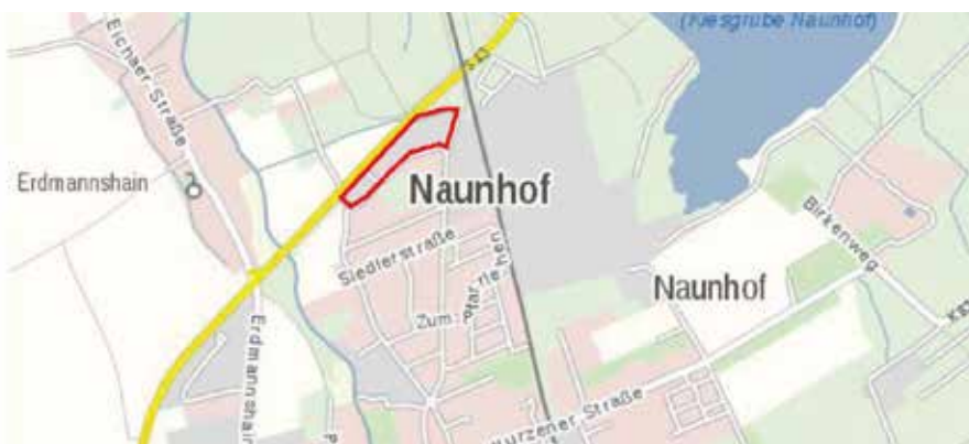
Räumlicher Geltungsbereich des Bebauungsplans: