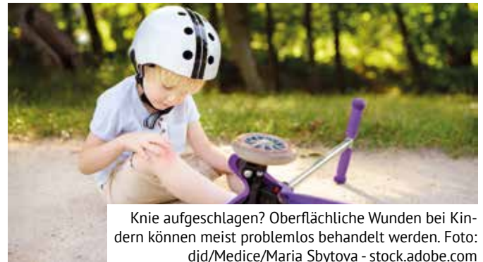
Knie aufgeschlagen? Oberflächliche Wunden bei Kindern können meist problemlos behandelt werden.

Im Anschluss lässt sich die Wunde in der Regel problemlos mit einfachen Maßnahmen behandeln. Dafür sollten Mama oder Papa sich zunächst die Hände gründlich waschen oder sterile Einmalhandschuhe anziehen. Dann wird die Wunde gereinigt, um die Gefahr einer Infektion zu minimieren. Besonders effektiv ist ein Wundreinigungsspray auf der Basis natürlicher Tenside. Diese sind schmerzfrem, brennen nicht und können Schmutz und schädliche Mikroorganismen lösen und ausspülen. Kleine Steinchen oder Splitter am besten