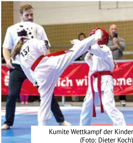
Kumite Wettkampf der Kinder

Wöchentlich werden mehr und mehr Aktivitäten auch im Sportbereich wieder möglich. So auch der Wettkampfbetrieb im eingeschränkten Maß. So können am 4. Juli die Kreis-Kinder- und Jugendspiele im Landkreis Leipzig im Karate vor Ort in der Sporthalle der Oberschule Naunhof ausgetragen werden. Zudem ist neben der Disziplin Kata in der Technikombination einzeln auch der Partnerkampf Kumite möglich. Einzige Einschränkung ist lediglich, dass Zuschauer den Kämpfen fernbleiben. Anmeldungen sind ab sofort möglich. Formulare sind bei den Trainern oder im Vereinsbüro erhältlich. Der Verein freut sich auf eine rege Beteiligung und spannende Wettkämpfe.