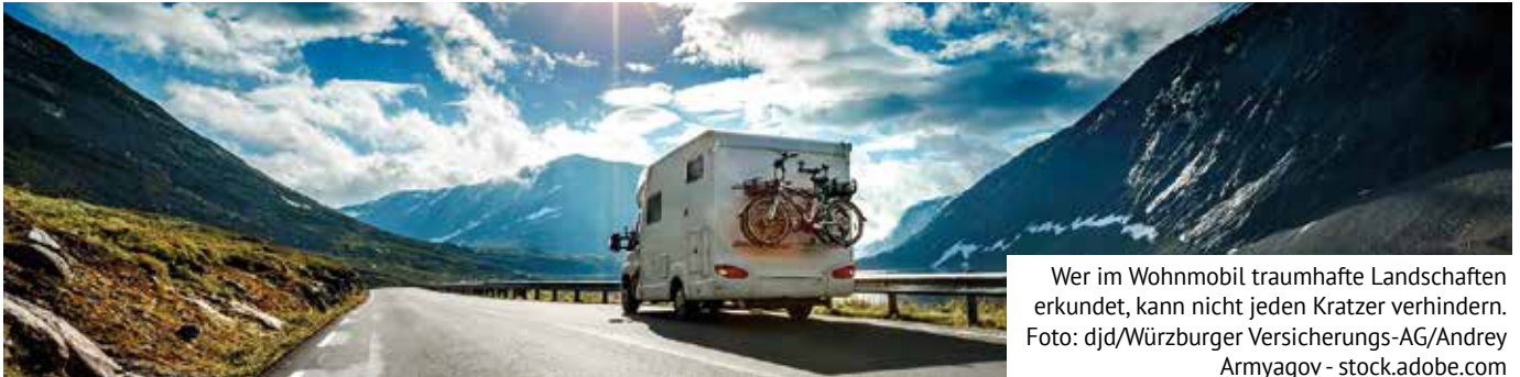
Wer im Wohnmobil traumhafte Landschaften erkundet, kann nicht jeden Kratzer verhindern.

Die Freiheit des Reisens im Wohnmobil mit dem Gefühl guter Vorsorge erleben