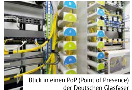
Blick in einen PoP (Point of Presence) der Deutschen Glasfaser

Alle Fragen zum Bau und den Verträgen beantwortet Ihnen ebenfalls die kostenlose Deutsche Glasfaser Bau-Hot-